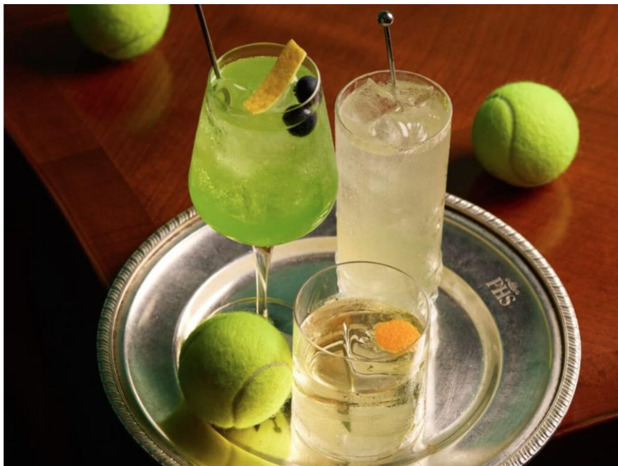
I signature cocktails Punto Decisivo e La Seconda Battuta