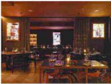
IT Milano, in via Fiori Chiari a Brera, si dedica ai grandi tagli di carne, da condividere.

Giappone, Brasile e Perù: un incontro, una scarica di energie parallele. Da questa triangolazione nasce Sushisamba, insegna internazionale della ristorazione contemporanea, che sceglie Milano per il suo debutto italiano con un indirizzo al primo piano di Torre Velasca. Il format, già noto in metropoli da Londra a Singapore, porta in città un'esperienza che unisce mixology e intrattenimento a una grammatica gastronomica ibrida e dichiarata: c'è chi lo chiama già "fun dining". La mano giapponese governa sushi, sashimi e specialità alla robata - la tradizionale griglia a carbone che qui dona un tocco di teatralità; poi immagina piatti Nikkei sposando i sapori peruviani, celebrati anche nei tiraditos e nei ceviche; il Brasile introduce specialità sudamericane. Attorno alla tavola prende forma una scena più ampia: cocktail, performance, dj, ballerini, percussionisti. E la Sambaroom, destinazione after-dinner aperta fino a tarda notte. di M.M.