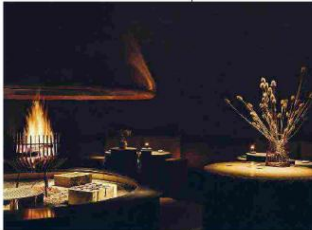
YERA, sopra il Forestis: una grotta nelle Dolomiti per scoprire la cucina della foresta.