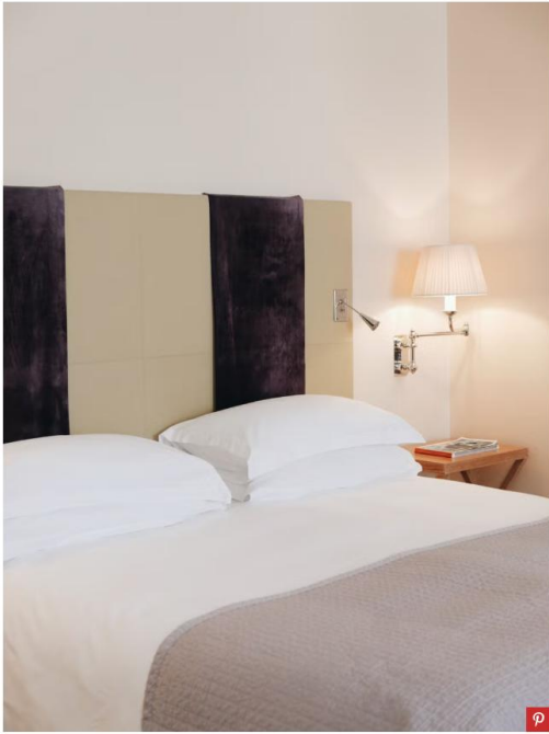
Mj Soeng Junior Suite