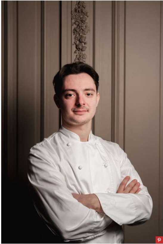
Sadiks And Voltaire