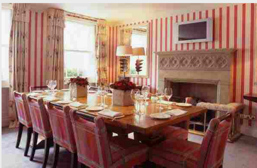
UN INTERNO DEL THE PELHAM