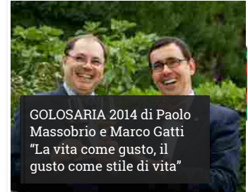
GOLOSARIA 2014 di Paolo Massobrio e Marco Gatti "La vita come gusto, il gusto come stile di vita"

novembre 18, 2014 GOLOSARIA 2014 di Paolo Massobrio e Marco Gatti "La vita come gusto, il gusto come stile di vita"