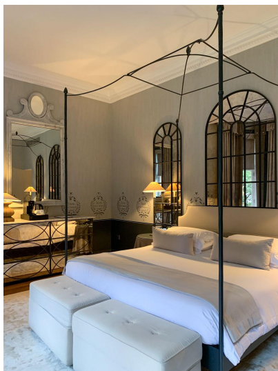
The Franklin London — Suite

Certaines chambres possèdent des balcons ou de petits espaces extérieurs protégés par des balustrades en fer forgé, comme le baldaquin des lits en volute, souvenir de Toscane.