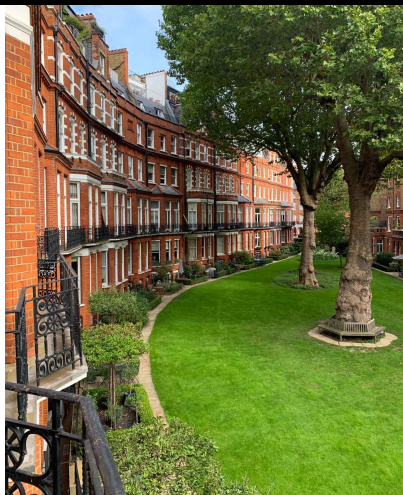
Vue depuis les chambres sur le jardin

Le ton est donné immédiatement, chic et sobre, par un camaïeu de gris, de velours italiens, de miroirs