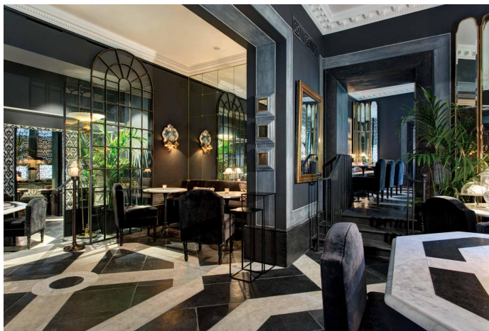
Le lobby et le restaurant

À The Franklin, pas de réception à proprement parler, mais un hall avec deux grandes tables octogonales en marbre de Carrare où l'on est accueilli par un concierge Clefs d'Or. Ici et dans le bar à champagne et Martini adjacent, le ton est donné immédiatement, chic et sobre, par un camaïeu de gris, de velours italiens, de miroirs sur les murs et le bar qui reflètent la lumière et apportent un côté à la fois élégant et décadent. Une bibliothèque et une alcôve circulaire avec une banquette moelleuse constituent deux possibilités pour un peu de tranquillité. Certains détails — balustrade en fer forgé, torchère à la forme néoclassique, marbre, estampes anciennes — convoquent un imaginaire toscan ou vénitien.