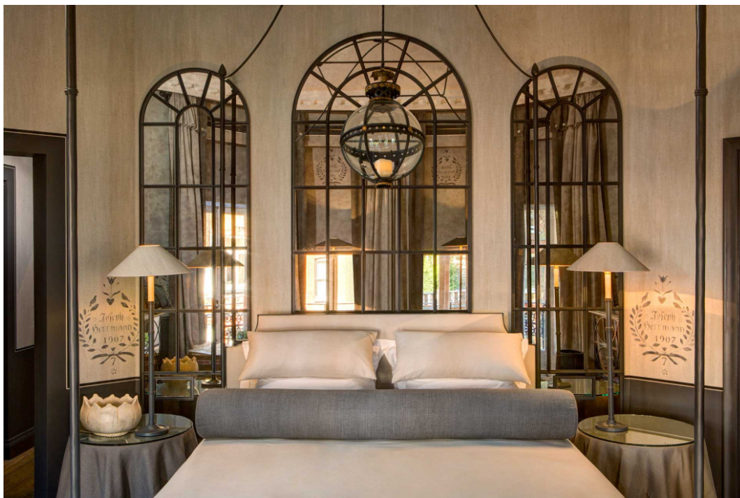
The Franklin — Garden Suite

Le charme de l'époque victorienne rencontre l'élégance de la décoration italienne, dans l'un des quartiers les plus chics de la capitale britannique.